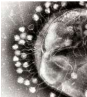
Graham Beards, Bakteriofāgu, kas piestiprināti pie baktērijas šūnas, elektronmikrogrāfija; palielinājums ~ 200 000 reižu.

Vīrusi mijiedarbojas ar visu veidu organismiem. Ir pat vīrusi, kas inficē milzu vīrusus, ko sauc par virofāgiem. No otras puses, daži organismi, ko sauc par virovoriem, ēd vīrusus. Virovori ir pazīstami jau vairākus gadu desmitus un protozoa Halteria , viens no vienšūnu ne-baktēriju radījumiem, var dzīvot tikai ar ekskluzīvu diētu no vīrusiem.